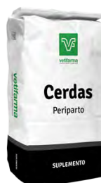
Suplemento Cerdas Periparto