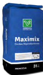
Maximix Cerdas Reproductoras