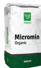
Micromin Organic Reforzador de la cáscara de huevo y mejorador de la consistencia de la clara