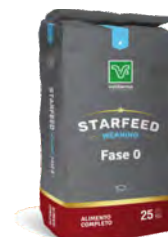
Starfeed Weaning alimento para lechones fase 0