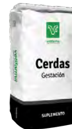
Suplemento Cerdas Gestación