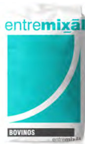
Feed Lot. Terminador 2,5%