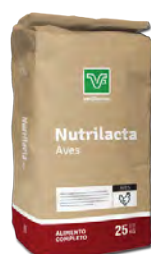
Nutrilacta Aves Alimento completo de Preiniciación