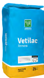
Vetilac ternero Lactoreemplazante