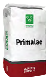
Primalac Alimento para lechones de súper preiniciación.