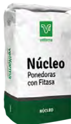
Núcleo Ponedoras con Fitasa Núcleo corrector