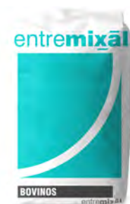
Feed Lot .Proteico 3%