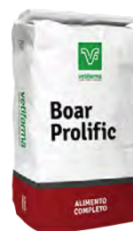
Boar Prolific Alimento pelleteado para machos reproductores