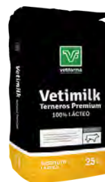
Vetimilk terneros premium Lactoreemplazante 100% Lácteo