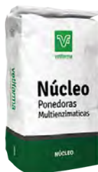
Nucleo Ponedoras Multienzimatico Núcleo corrector