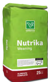
Nutrika Weaning Alimento de preiniciación completo