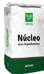
Núcleo Aves Reproductoras corrector Vitamínico Mineral