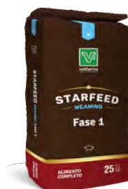
Starfeed Weaning alimentos para lechones fase 1 Alimento completo de preiniciación.