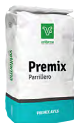
Premix Parrilleros Premezcla Vitamínico Mineral