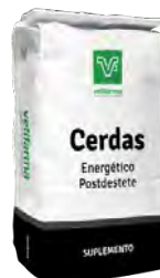
Suplemento Energético Postdestete