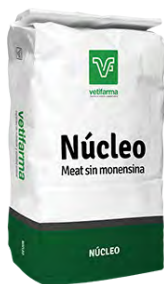
Núcleo Meat sin monensina