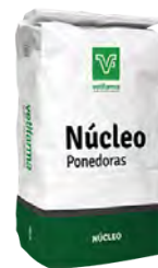
Núcleo Ponedoras Núcleo corrector vitamínico - mineral