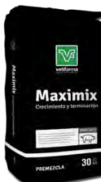
Maximix Crecimiento y Terminación