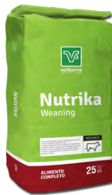
Nutrika Weaning Alimento de preiniciación completo