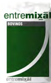
Vacas Lecheras 20% Pellet