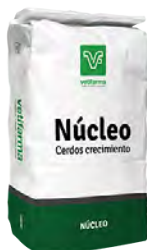
Nucleo Cerdos Crecimiento