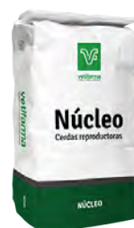
Nucleo Cerdas Reproductoras