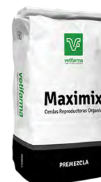
Maximix Crecimiento y Terminación Ultra