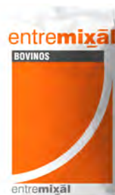
Novillo 10% Pellet