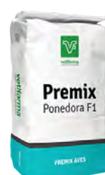
Premix Ponedora F1 Premezcla vitamínico mineral