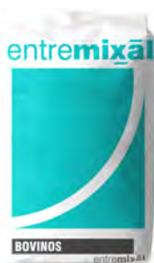
Feed Lot .Indicador 2,5%