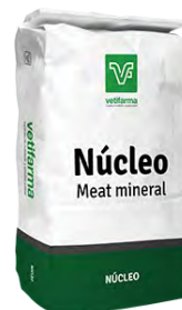
Núcleo Meat mineral