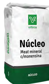
Núcleo Meat mineral con monensina