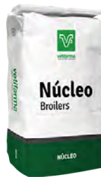
Nucleo Broilers corrector vitamínico - mineral