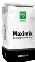
Maximix Cerdas Reproductoras Plus